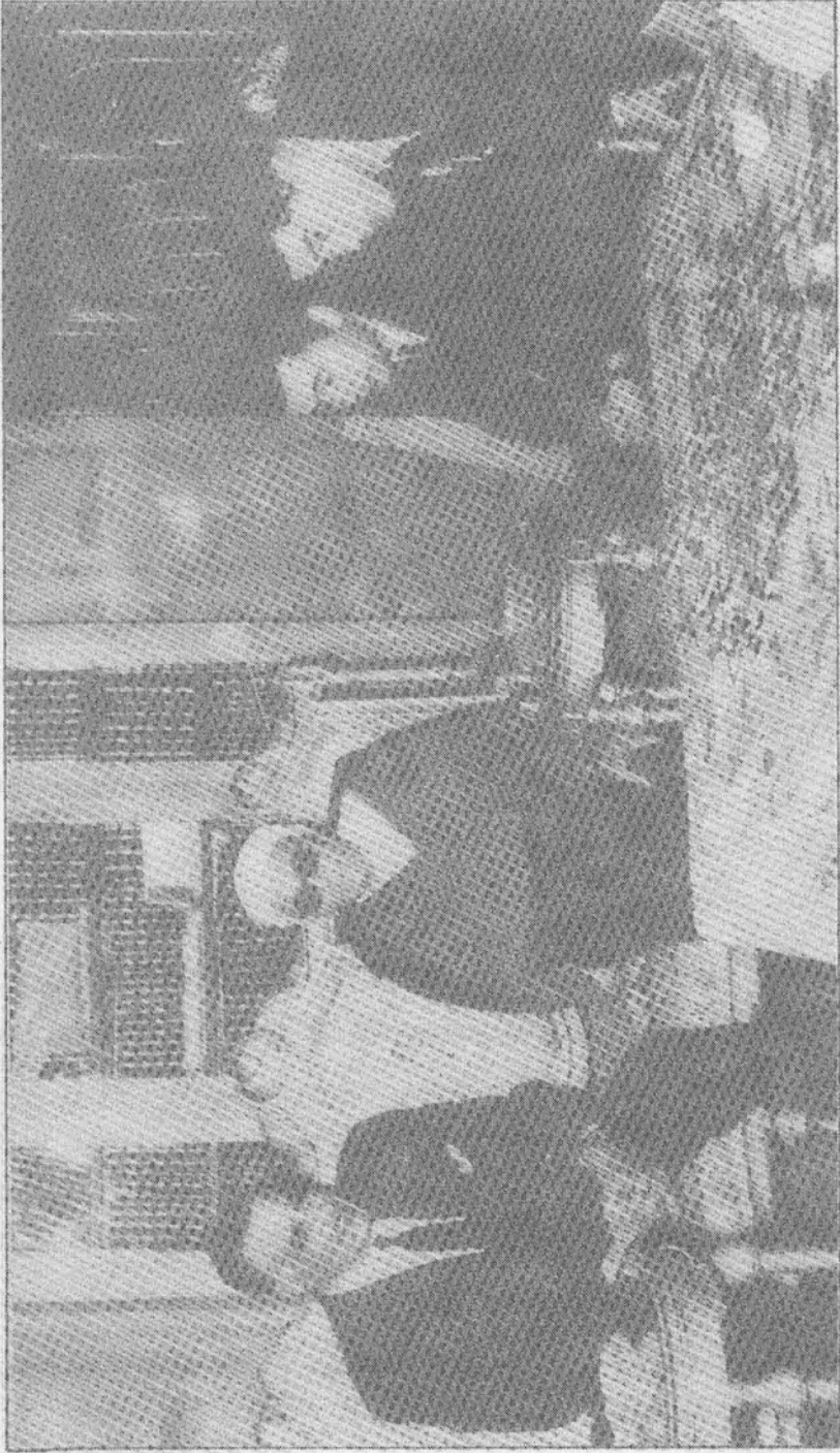
الأمير محمد الخطابي ضيف الرئيس المصري جمال عبد الناصر مع أبنائه في بيت الخطابي